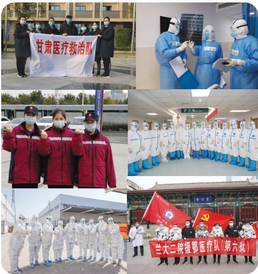
▲ 援助湖北医疗队队员

援助期间,队员们克服体能和生活的种种困难,规范、高效的完成援助期间各项工作任务,为患者送去安慰和希望,疏解他们紧张焦虑的情绪,坚定战胜疾病的信心,展现了专业的职业素养和良好的精神风貌,用自己的实际行动诠释了“敬佑生命、救死扶伤、甘于奉献、大爱无疆”的崇高职业精神。