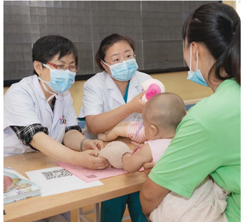
8月1日—8月7日是第29个世界母乳喂养宣传周。今年的活动主题是“支持母乳喂养,守护健康地球”。8月6日上午,甘肃省儿童医院联合产科在儿科门诊开展“世界母乳喂养周”宣传活动。