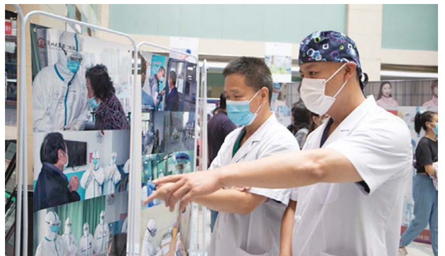
8月19日,由院工会、院党委宣传部主办,摄影协会承办的“共援·大爱”中国医师节暨兰大二院抗击疫情职工摄影展开展。本次摄影展全面展现了我院医务人员不忘初心、勇担使命的精神风貌。